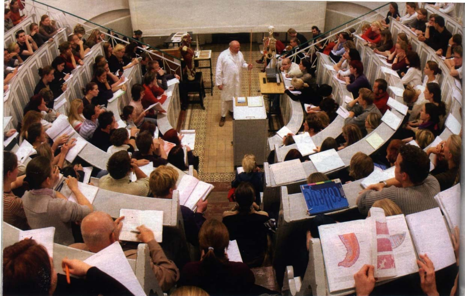
Medizin-Vorlesung (in Halle): Notfalls auf Pump studieren