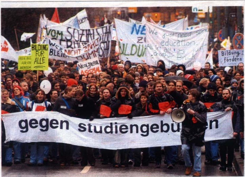
Studentenprotest (in Frankfurt am Main): Größter Umbruch der letzten Jahrzehnte

Studenten alljährlich Tausende von Euro eintreiben.